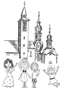
Frauengemeinschaft Freudenberg - 1874

Bitte bringen Sie Ihre Nähmaschine, Ihr Nähprojekt und evtl. ein Verlängerungskabel mit.