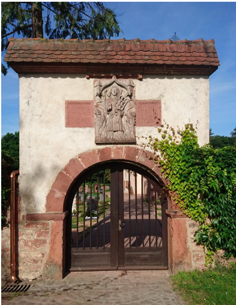
Eingangsportal Friedhof Freudenberg mit Relief des Hl. Laurentius