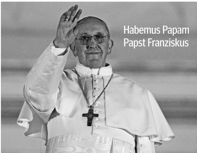
Habemus Papam Papst Franziskus

Redaktionsschluss für das Pfarrblatt ist 13.05.2013