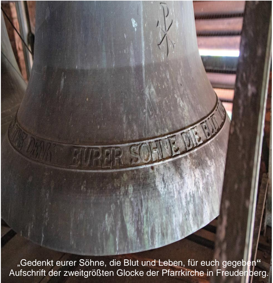
„Gedenkt eurer Söhne, die Blut und Leben, für euch gegeben“ Aufschrift der zweitgrößten Glocke der Pfarrkirche in Freudenberg.

Im Monat November gedenken wir in besonderer Weise unserer lieben Verstorbenen, auch derer, die in den Wirren der Kriege oder durch Gewalt ums Leben gekommen sind.