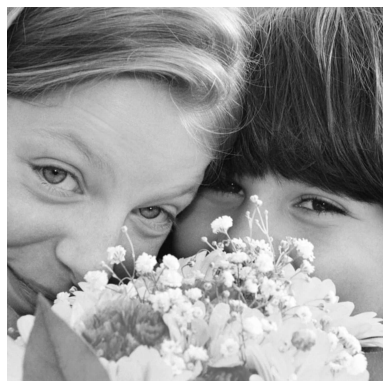
Ob Freud oder Leid, eine Mutter ist stets bereit.

Freudenberg: 19.00 Maiandacht der Frauengemeinschaft Boxtal: 09.00 Eucharistiefeier 09.45 Bücherei geöffnet – kostenlose Ausleiherung Rauenberg: 10.30 Eucharistiefeier